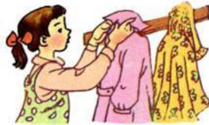
Bé treo áo lên m□'.